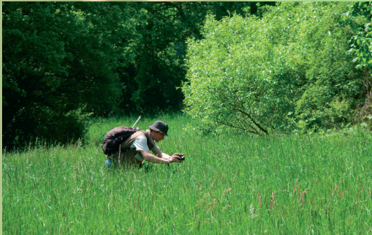
Être attentif à la végétation alentour

I. – Sont interdits sur tout le territoire métropolitain et en tout temps: [...] la perturbation intentionnelle des oiseaux, notamment pendant la période de reproduction et de dépendance [...].