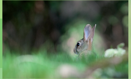
Respecter une distance suffisante

II. – Sont interdites sur les parties du territoire métropolitain où l'espèce est présente ainsi que dans l'aire de déplacement naturel des noyaux de populations existants la destruction, l'altération ou la dégradation des sites de reproduction et des aires de repos des animaux [...].