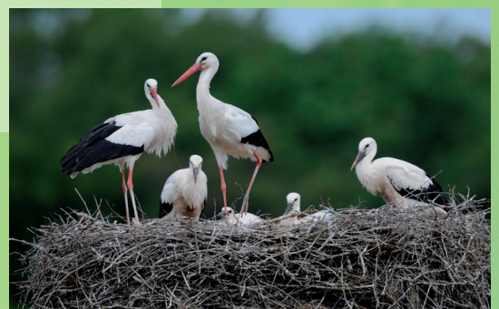
Ne pas photographier les oiseaux au nid, sauf les espèces peu farouches

LPO Alsace - 8 rue Adèle Riton 67000 Strasbourg 03 88 22 07 35 alsace@lpo.fr http://alsace.lpo.fr