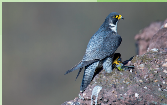
Ne pas indiquer la localisation des clichés pour les espèces rares