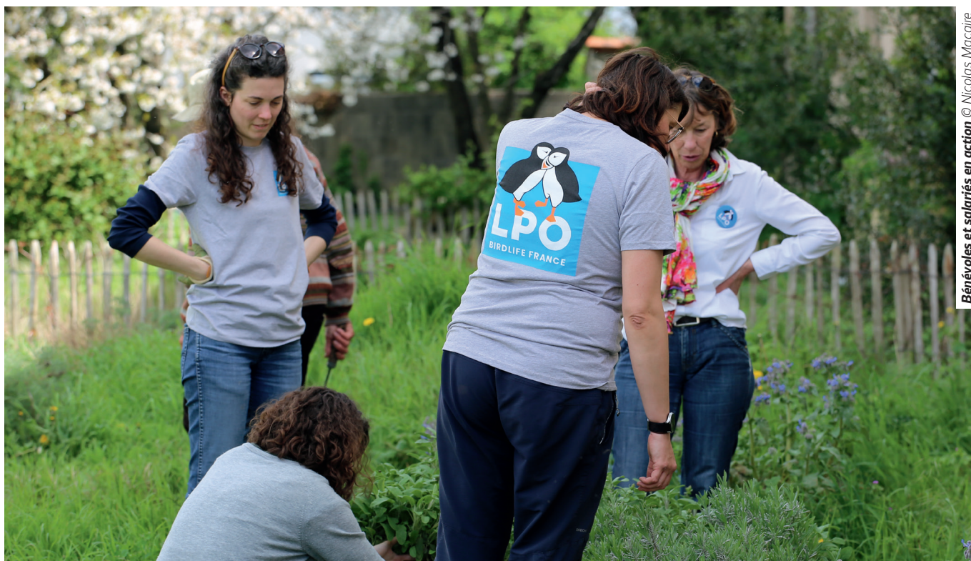
Bénévoles et salariés en action