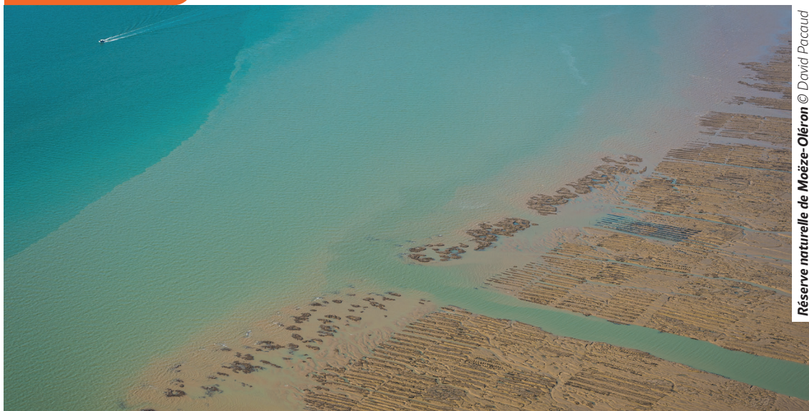
Réserve naturelle de Moëze-Oléron

La LPO est la plus grande des associations françaises de protection de la nature. Créée en 1912 pour défendre la colonie de macareux moines des Sept-Iles et, plus globalement, tous les oiseaux en France, elle élargit officiellement en 2012 son champ d'action à l'ensemble de la biodiversité et des animaux sauvages. Elle agit pour la connaissance et la protection des espèces, le développement et la préservation des espaces protégés, la sensibilisation et la mobilisation des citoyens, et l'accompagnement des entreprises et des collectivités. L'association est reconnue d'utilité publique depuis 1986. Elle est le représentant officiel de BirdLife International en France.