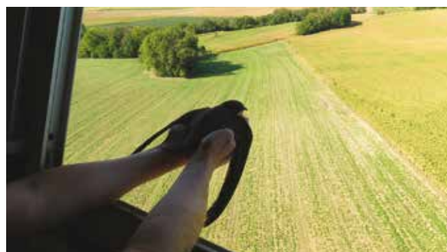
Lors du lâcher à la tour d'Oberhausbergen, dernier coup d'oeil avant l'envol