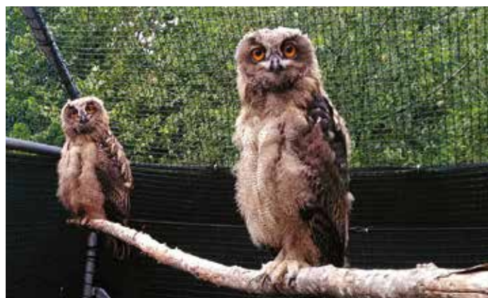
Jeunes grands-ducs