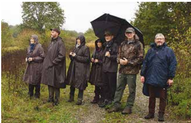
Les nouveaux membres du groupe Mulhouse et Environs

Ce groupe a pour but de réaliser des actions concrètes de découverte et de protection de la nature. Une première sortie est déjà programmée en octobre et bien d'autres vont suivre.