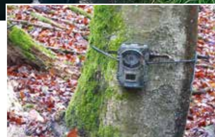
Le piège photo se déclenche lors de tous mouvements détectés...

Plus d'informations sur l'espèce sur http://cigogne-noire.fr