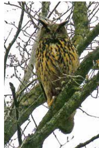
A gauche : faucon pèlerin et à droite un grand-duc d'Europe