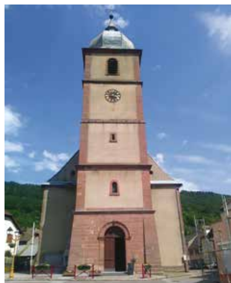
L'église de Saint-Amarin, havre de biodiversité !

A l'initiative de Lucien Arnold, les 2 nichoirs situés côté arrière de l'édifice ont été déplacés et installés côté façade à proximité du nichoir existant. Dès cette nouvelle mise en place, un des nichoirs était déjà visité par un faucon crécerelle ! Ces rapaces, qui fréquentent les arbres aux alentours, ont remarqué rapidement la présence de ces deux nouvelles ouvertures supplémentaires côté entrée de l'église (le