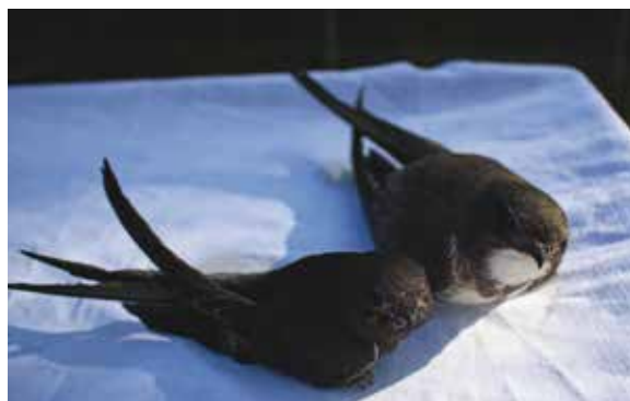
Le martinet à ventre blanc, plus massif, à côté d'un martinet noir