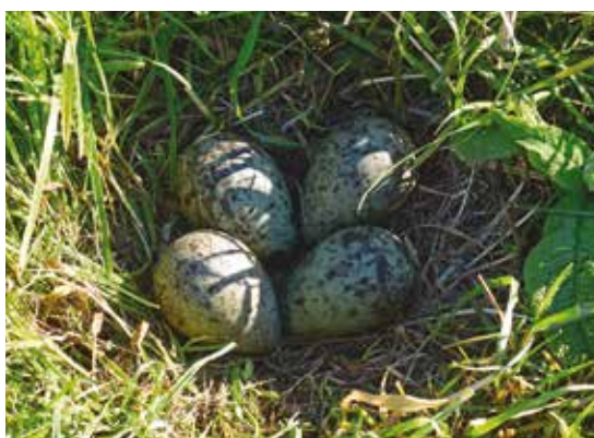
Un des rares nids de courlis

Rappelons qu'en Alsace, grâce à l'action de la LPO Alsace, le courlis cendré, même s'il n'est pas classé « espèce protégée », n'est plus chassable sur tout le territoire.