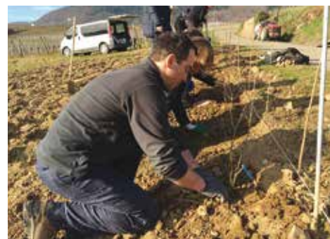
Plantation de haies d'essences locales dans les parcelles de vignes