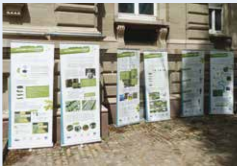
Exposition sur la TVB