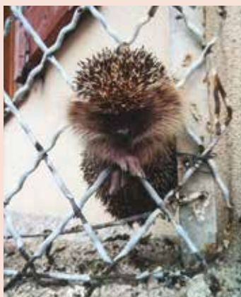
Hérisson pris au piège