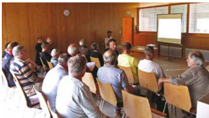
Une vingtaine de personnes engagées dans la protection des oiseaux rupestres à Rosenwiller

Une vingtaine de participants se sont ainsi retrouvés le 14 septembre à Rosenwiller pour faire le point. Au total, le réseau est constitué d'une cinquantaine de personnes, pour la plupart bénévoles de la LPO ou d'associations partenaires, ainsi que de quelques salariés d'associations naturalistes ou de structures gérant des milieux naturels, notamment les 2 parcs naturels régionaux.