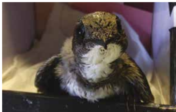
Le jeune martinet à son arrivée au centre de soins