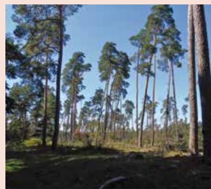
La forêt du Bienwald

Un autre projet a consisté à recréer une forêt claire de pins sylvestres avec en sous-bois une lande pâturée par des chèvres sur une surface de 120 ha. L'objectif est de favoriser l'engoulement, l'alouette lulu, l'armérie maritime et divers insectes des sols sablonneux. Enfin, les prairies des rieds bordant le Bienwald ne sont pas oubliées avec des regroupements de parcelles dans le but de renforcer les populations du tarier des prés, du cuivré des marais et autres azurés de la sanguisorbe et des paluds. 1680 ha de forêt en libre évolution, 120 ha de forêt claire pâturée, des restaurations de prairies humides, autant de projets dont on pourrait davantage s'inspirer en Alsace !