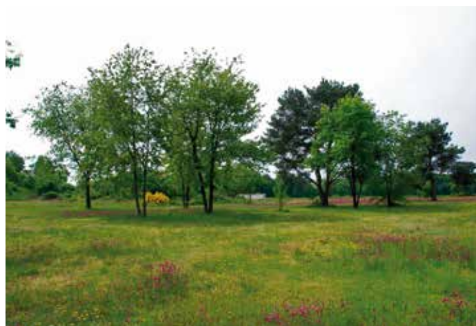
Gestion écologique de la pelouse du parc

Côté aménagements, il est également prévu de créer des bandes refuges non fauchées (ou tondues) dans les espaces ouverts et sur les pelouses, et de planter des linéaires supplémentaires de haies, exclusivement basées sur des essences locales de ligneux.