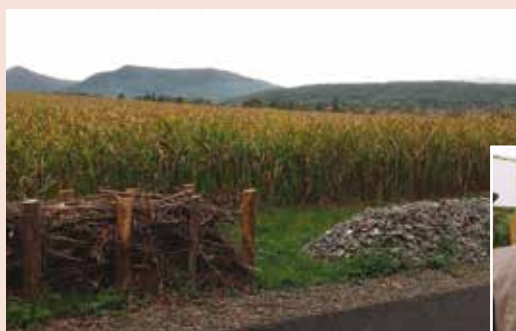
Haies mortes et tas de pierres le long de la nouvelle voie verte et stand LPO

En savoir plus sur la voie verte : http://portes.mso-tourisme.com/