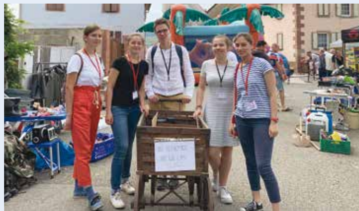
L'équipe d'Animals Aware, ici à Schwindratzheim

La LPO Alsace salue chaudement le dynamisme de ce Club citoyen et remercie tous ses membres pour ces belles actions ainsi que l'association de Schwindratzheim.