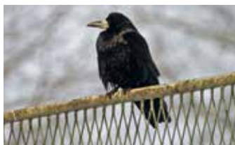
Corneille noire, renard, fouine, et corbeau freux qui restent les espèces mal-aimées...

au classement en tant qu'ESOD. Toutefois, cette perspective a interpellé chasseurs et agriculteurs qui ont transmis in extremis des données. Bien qu'insuffisantes, elles ont tout de même mené à leur maintien dans cette funeste liste.