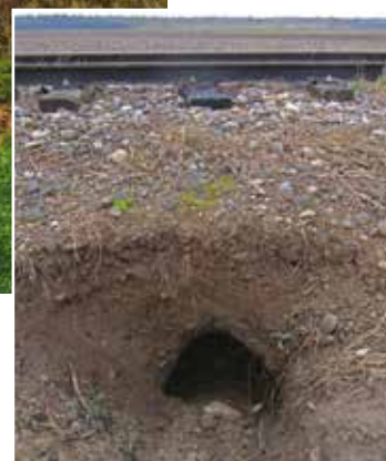
Terriers de blaireaux en contrebas de voies ferrées