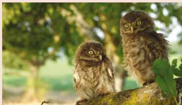
Jeunes chevêches d'Athéna