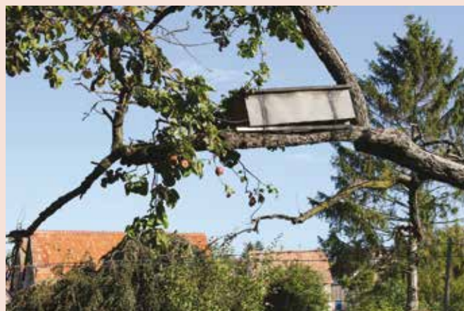
Nichoir à chevêche, épicéa avec nid de moyen-duc et grange avec nichoir à effraie