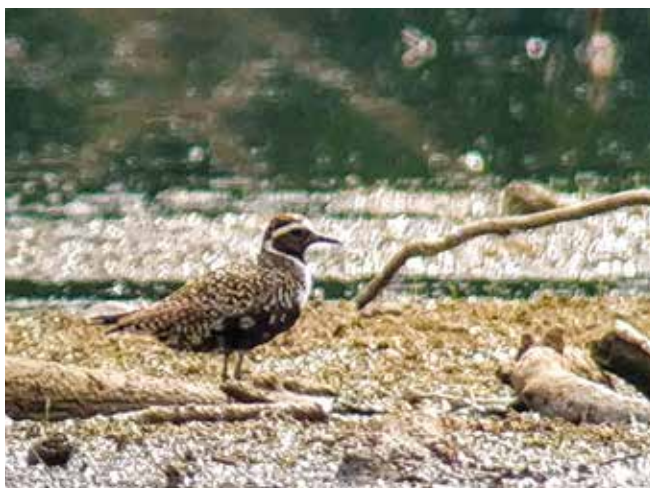
Pluvier bronzé

Août : Encore un mois riche en haltes migratoires d'exception ! Au plan d'eau de Plobsheim, avec notamment : 1 huitrier-pie le 10, 2 phalaropes à bec étroit du 25 au 30, plusieurs sternes caspiennes (max. 7 le 25) et 4 sternes caugeks le 29. Ailleurs : plusieurs