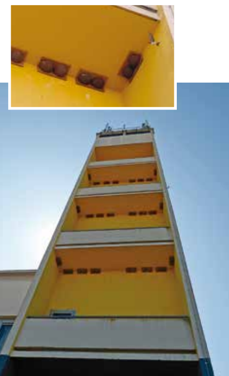
60 nids artificiels installés sur le bâtiment de PSA