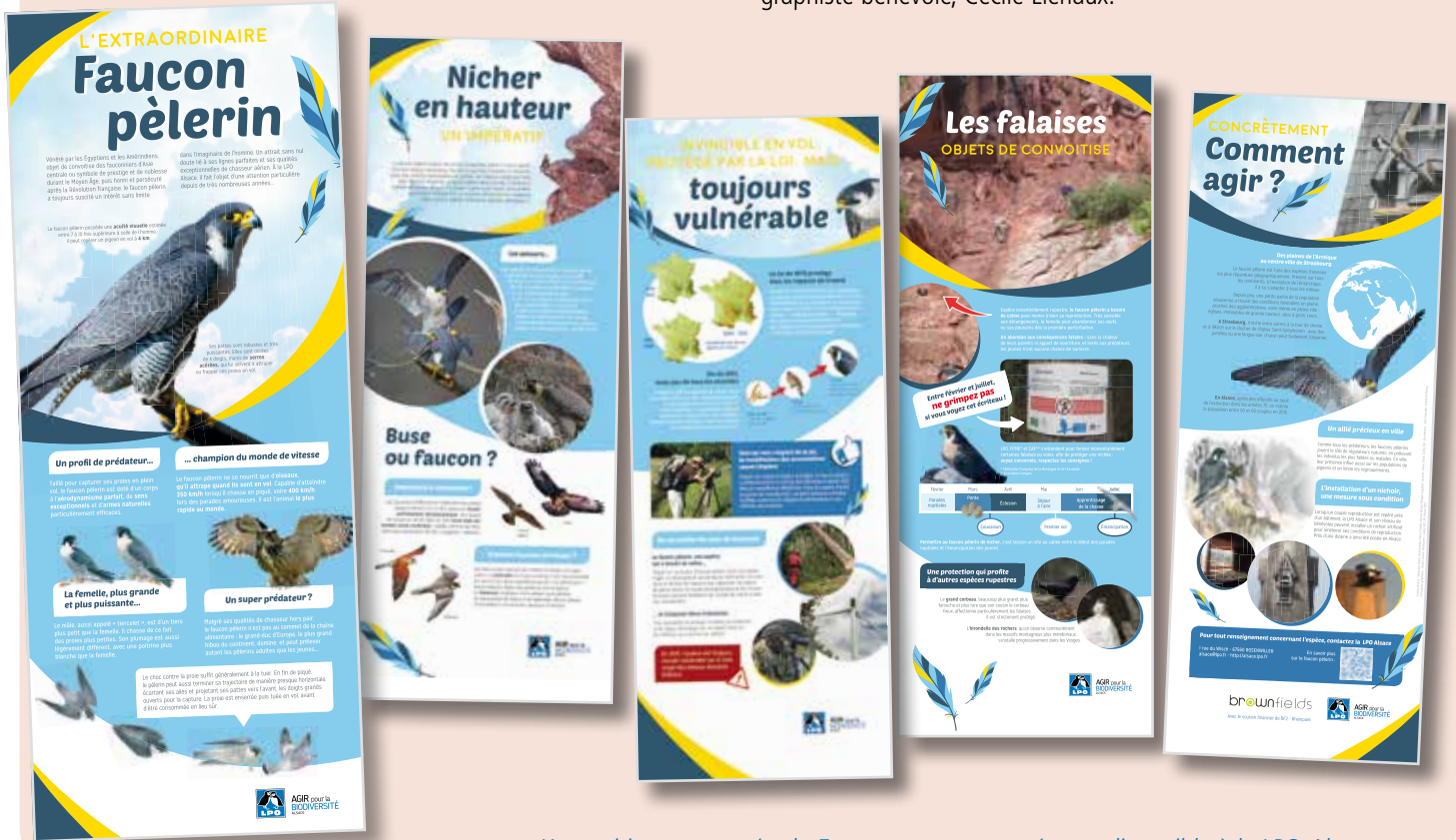
L'exposition, composée de 5 panneaux autoportés, est disponible à la LPO Alsace

L'entreprise a aussi financé la réalisation d'une exposition sur l'espèce : description de sa biologie, de son statut et de l'historique de ses effectifs, menaces qui pèsent sur elle, méthodes de protection y sont expliqués. Une façon de mieux sensibiliser les différents publics à cet oiseau au statut encore fragile en Alsace (voir ci-contre). L'exposition a été réalisée par la LPO Alsace, avec le soutien des spécialistes bénévoles de l'espèce et l'aide d'une graphiste bénévole, Cécile Liénaux.