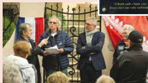
Inauguration de la plaque commémorative