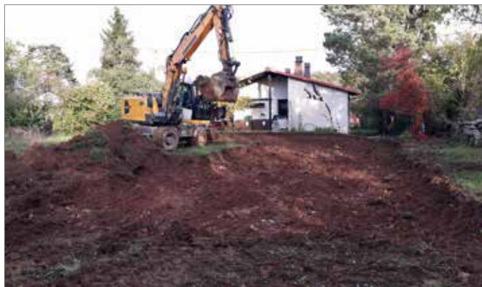
Démarrage du gros œuvre à Rosenwiller, mi-octobre

L'entreprise LOHR, le Lions Club de Molsheim - Vallée de la Bruche, Le Fonds Nora, La Fondation Nature et Découvertes, les ballastières Helmbacher, ainsi que la grande majorité des entreprises impliquées dans la construction du centre.