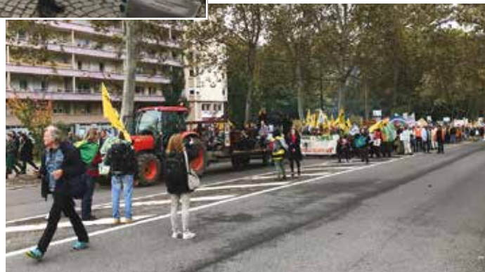
Près de 1000 personnes ont défilé le 22 octobre, dont des bénévoles et des salariés de la LPO Alsace