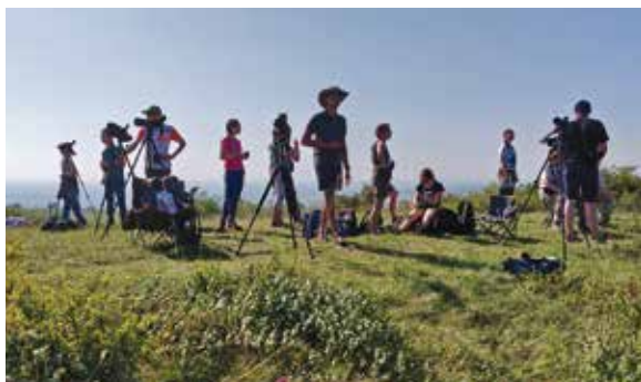
Observation des oiseaux migrateurs au Strangenberg

palombes, un épervier d'Europe, 2 faucons pèlerins, une tourterelle des bois et divers passereaux dont 2 bruants zizis chanteurs, 2 pies-grièches écorcheurs, et un duo de gobemouches gris en halte.