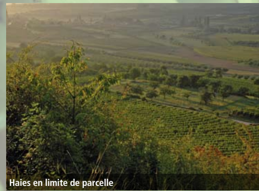
Haies en limite de parcelle

On préférera l'utilisation de lamiers à bras, qui opèrent une coupe franche des sections, plutôt que les habituels marteaux qui déchiètent le bois, rendant la plante plus sensible aux maladies. Quoiqu'il en soit, les opérations d'entretien devront toujours se faire après la descente de sève, lorsque la plante est en stade végétatif.