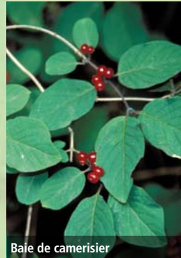
Baie de camérisier