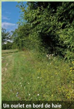
Un ourlet en bord de haie