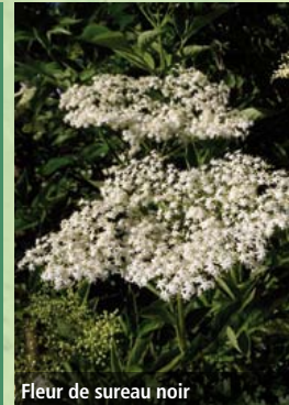
Fleur de sureau noir

En limite de parcelles, sur les talus, le long des chemins, les haies rythment et structurent le paysage viticole. Leurs rôles écologiques ne sont plus à démontrer, de même que les services rendus à l'agriculture. Ainsi, lorsqu'elles sont composées d'essences locales variées, elles représentent un habitat pour de nombreuses espèces, et peuvent être la colonne vertébrale pour une trame verte. Les haies réduisent également l'écoulement des eaux de ruissellement et limitent le lessivage des sols. De plus, la présence de cet écosystème fonctionnel à proximité des espaces cultivés permet la régulation des prédateurs des cultures, en accueillant les espèces qui leur sont utiles.