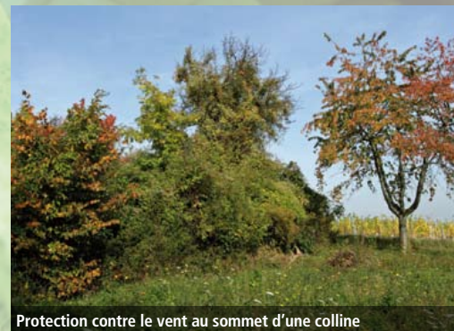
Protection contre le vent au sommet d'une colline