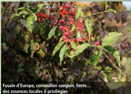
Fusain d'Europe, cornouiller sanguin, lierre... des essences locales à privilégier.

Plaquette réalisée par la LPO Alsace - 8, rue Adèle Riton 67000 STRASBOURG 03 88 22 07 35 alsace@lpo.fr http://alsace.lpo.fr Illustrations : Bruce Ronchi Imprimé sur papier recyclé imp. SCHEUER 67320 Drulingen Avril 2011