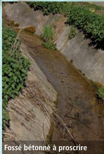
Fossé bétonné à proscrire