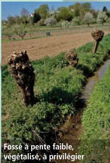
Fossé à pente faible, végétalisé, à privilégier