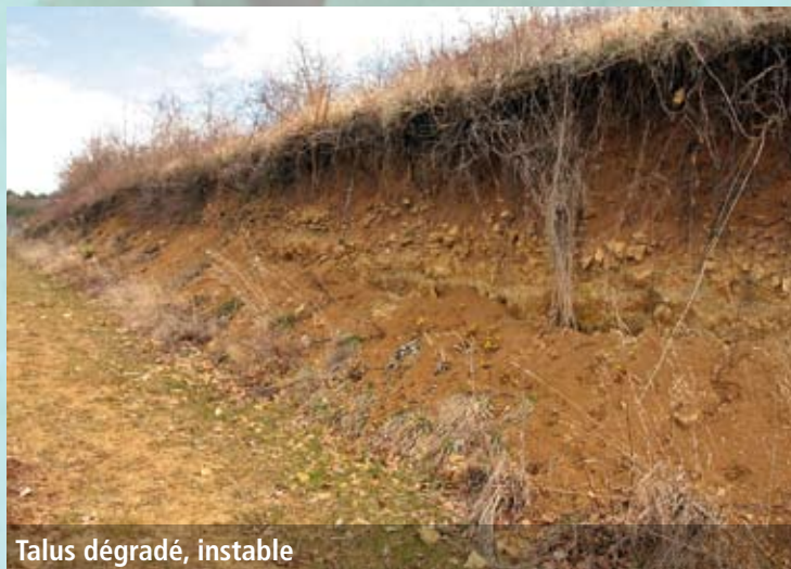
Talus dégradé, instable