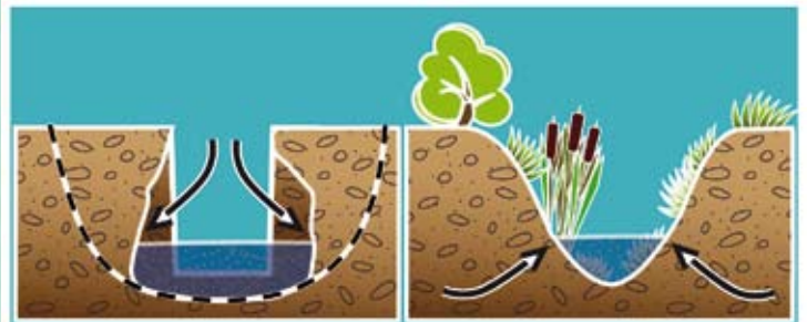
Schéma 1a : chenal étroit avec fort risque d'érosion liée à l'écoulement de l'eau, conduisant à l'élargissement et au rehaussement du chenal.