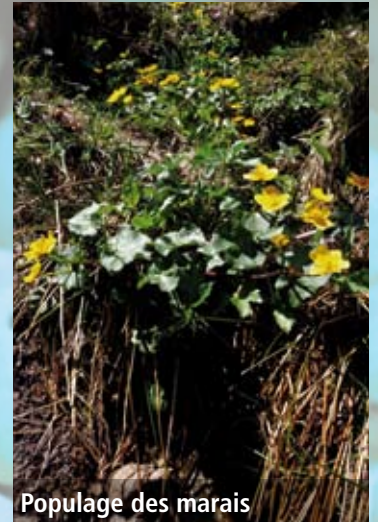
Populage des marais