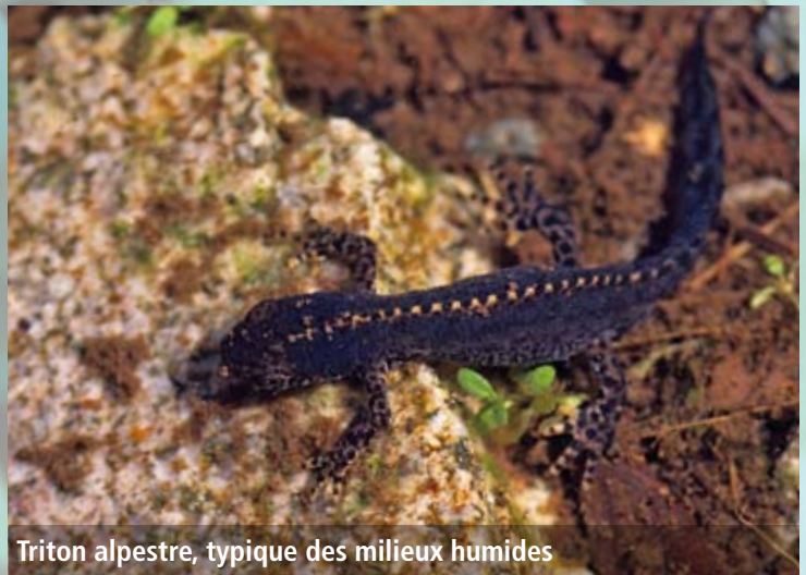
Triton alpestre, typique des milieux humides

Dans le cas de secteurs vulnérables aux fortes précipitations, la création d'un fossé de récupération d'eau perpendiculaire à la pente peut s'avérer très utile. Ce fossé peut être renforcé par la mise en place d'un talus surélevé, afin de freiner davantage les ruissellements d'eau. En retenant cette eau, fossés et talus contribuent entre autres à la filtration de cette eau et donc à l'amélioration de sa qualité. A ce titre, on peut considérer qu'ils jouent le rôle d'épurateur naturel.