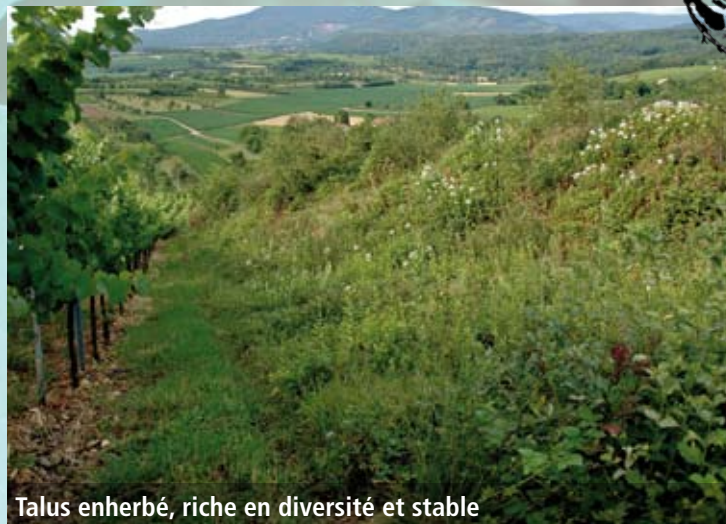
Talus enherbé, riche en diversité et stable