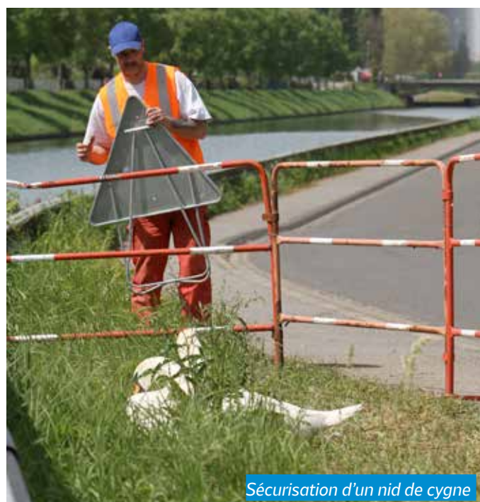
Sécurisation d'un nid de cygne