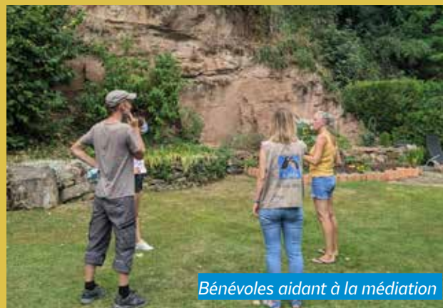
Bénévoles aidant à la médiation