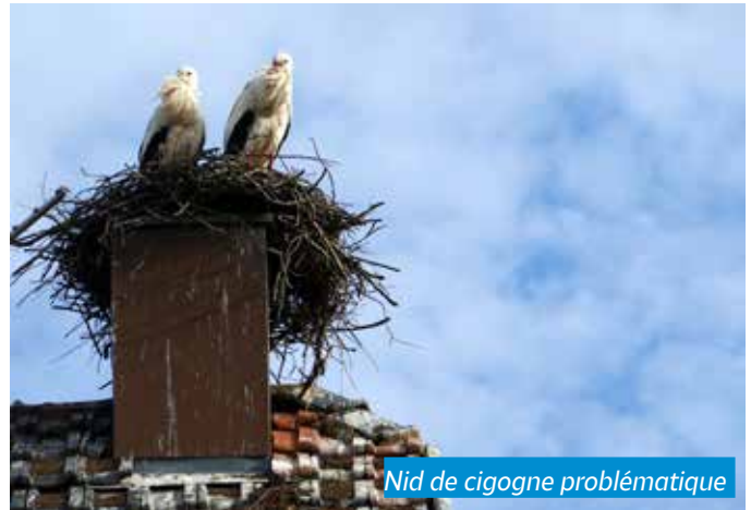
Nid de cigogne problématique

Ces démarches - longues et complexes - sont à réaliser systématiquement lorsqu'un nid pose des problématiques de cohabitation ou nécessite un déplacement pour des raisons de sécurité : nid sur une cheminée en activité (risques d'obstruction du