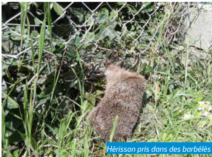
Hérisson pris dans des barbelés

Le suivi du dossier pour assurer la mise en place de mesures compensatoires peut ensuite demander beaucoup de temps et d'investissements.