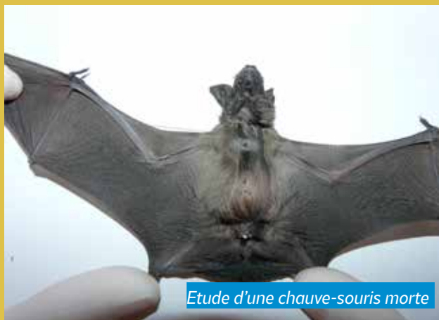
Etude d'une chauve-souris morte

En 2022, 118 cadavres ont ainsi été analysés.