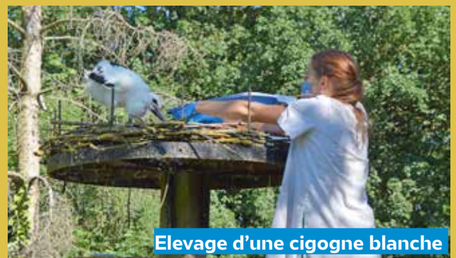
Elevage d'une cigogne blanche