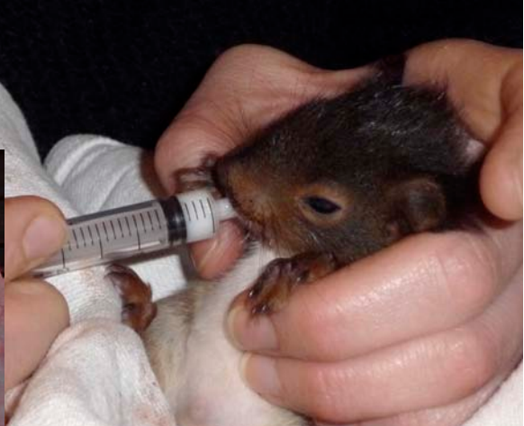
Jeune écureuil roux