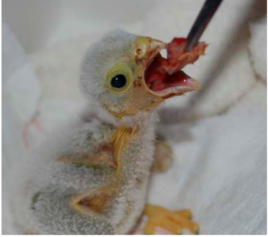
Jeune faucon crécerelle

Le faucon pèlerin prend son envol après plusieurs semaines de convalescence. Un faucon pèlerin et une buse ont été relâchés hier dans une prairie du ried à Muttersholtz. Depuis mi-juin, les deux jeunes rapaces étaient soignés au centre de sauvegarde pour la faune sauvage de la Ligue pour la protection des oiseaux (LPO), situé à Rosenwiller. Après l'abattage de l'arbre où se trouvait son nid, dans le Haut-Rhin, la buse a dû se rétablir d'une fracture à la patte. Le faucon pèlerin, espèce dont l'habitat