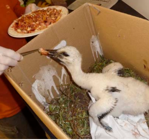
Jeune cigogne blanche