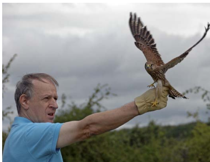
Lâcher d'un faucon crécerelle

Centre de sauvegarde LPO Alsace 1 rue du Wisch, 67560 ROSENWILLER 03 88 04 42 12 alsace.mediation@lpo.fr