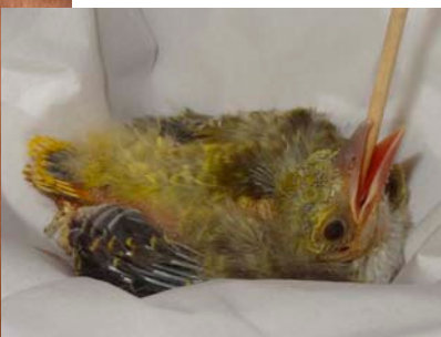
Jeune loriot d'Europe