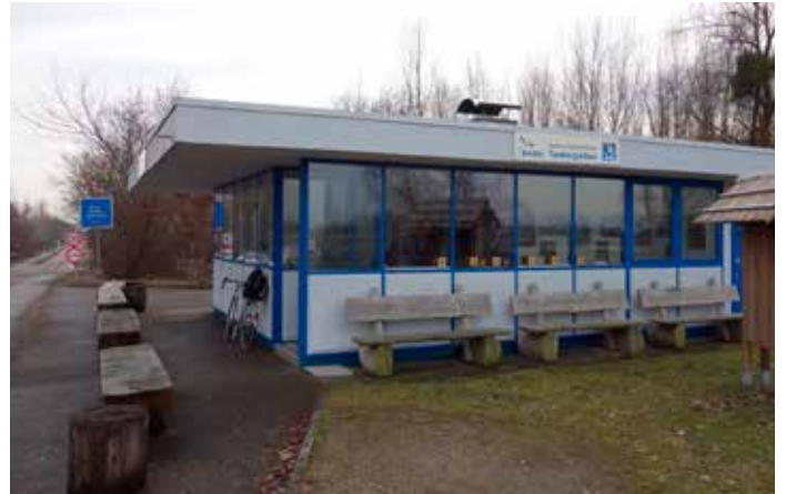
Centre d'information du Tauberggiessen