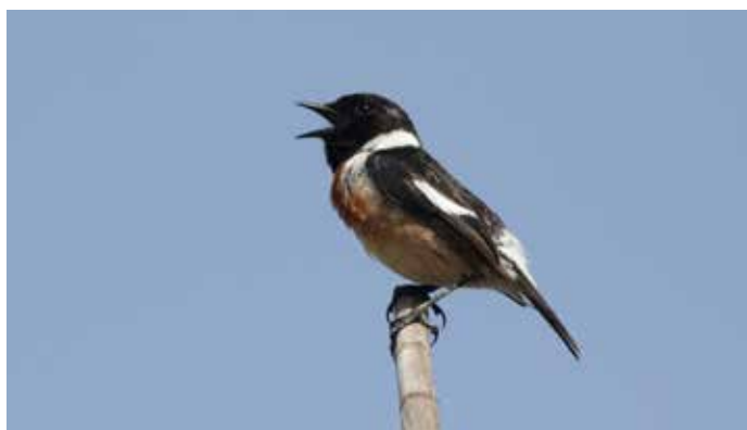
Le tarier pâtre, choisi comme Oiseau de l'année en 2016