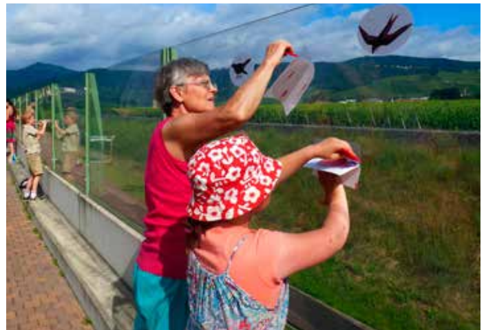
Pose de silhouettes avec les élèves de l'école de Wintzenheim