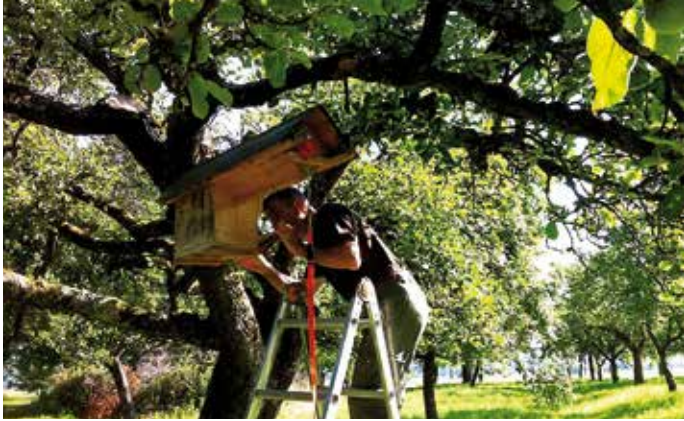
Installation de nichoir à chevêche

d'exploitation écologique pour produire de l'énergie tout en favorisant la biodiversité